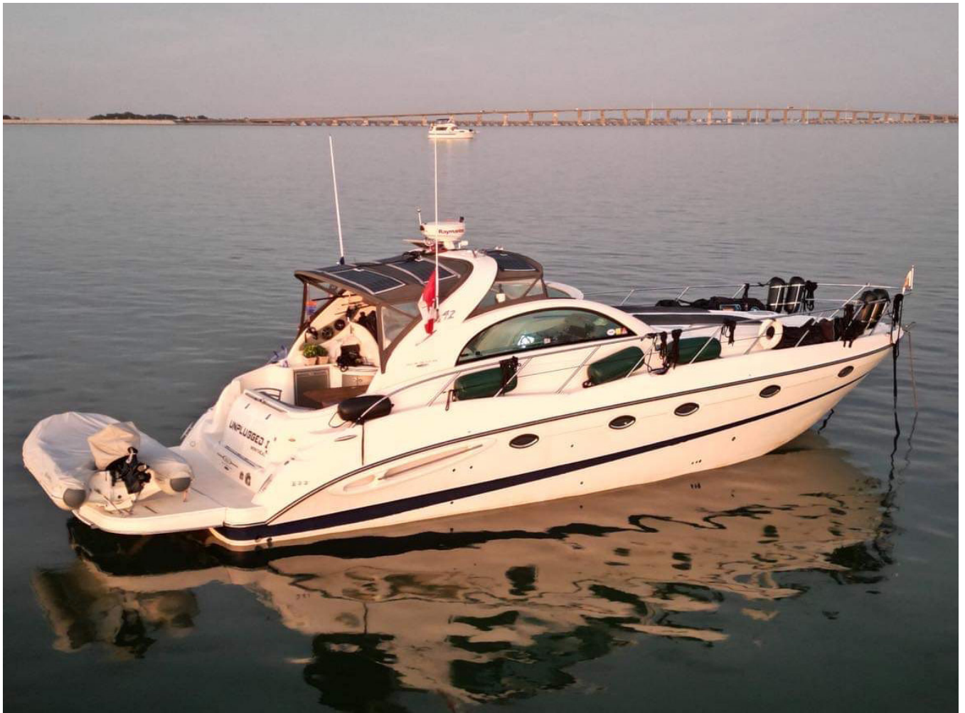
Le bateau Unplugged I qui parcourt actuellement la Grande Boucle.

embarcation peut passer sous plusieurs ponts de 8 pieds, il vous sera possible de transiter par le Canal-de-Lachine et d'admirer les joyaux historiques de ce merveilleux site.