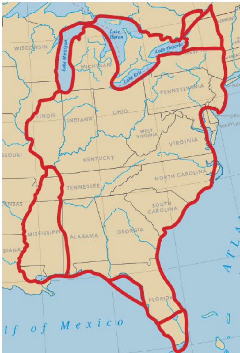
Le trajet de la Grande Boucle.

La Grande Boucle est un parcours d'un peu plus de 9650 km qui permet aux plaisanciers, à bord de leur propre embarcation, de naviguer notamment les canaux historiques de Parcs Canada, les Grands Lacs, les rivières intérieures situées en Amérique du Nord, les canaux de l'État de New York et la voie navigable intercôtière de l'Atlantique. Il faut environ un peu plus d'un an pour parcourir la Grande Boucle, mais il est toujours possible de moduler son itinéraire en fonction des besoins du voyage. Dans le cas de Jean-Marc et de sa femme Tanya, ils ont quitté Valleyfield le 18 août 2022 à bord de leur embarcation surnommée Unplugged I pour y vivre l'expérience d'une vie. Avec en tête la devise « Pas d'horaire, pas d'itinéraire », ils parcourent la Grande Boucle à leur rythme et estiment qu'ils seront de retour au Québec au mois d'octobre 2023, juste avant la fermeture des canaux historiques du Canada.